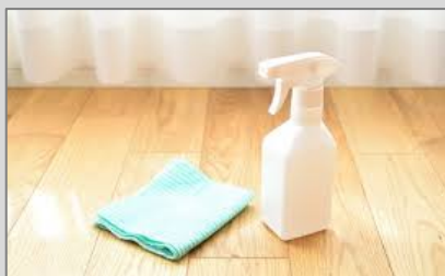
施設内の除菌・消臭