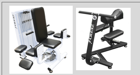
トレーニング器具の除菌